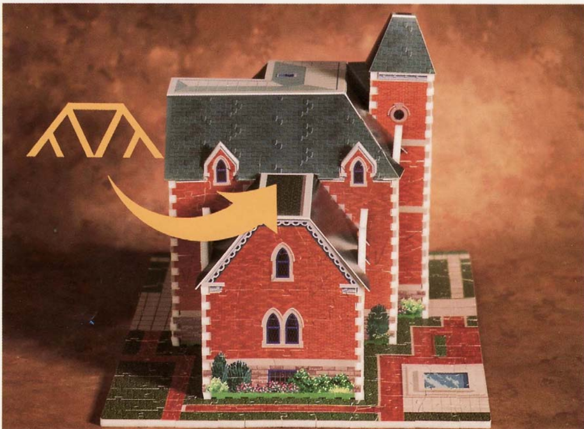
LEFT SIDE/CÔTÉ GAUCHE